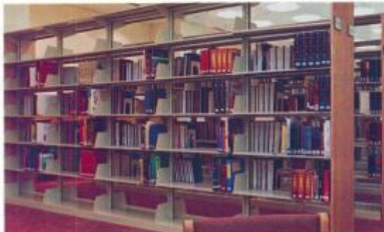
أخبار المكتبة (٥)

٥ - تركت أرقام بعض المدن الواردة في الخطة الرئيسية ولم تتفرع من الأصل حفاظاً على منهجية الخطة ولكونها مدناً رئيسية كبيرة يفضل أن تكون لها أرقام مستقلة . مثال جدة ٩٥٣ر١٢٣ أخذت رقماً مستقلاً ولم تتفرع من مكة المكرمة . ومثال مداخل صالح التي أعطيت رقم ٩٥٣ر١٢٨ ولم يتفرع من العلا ورقمها ٩٥٣ر١٢٢٤ .