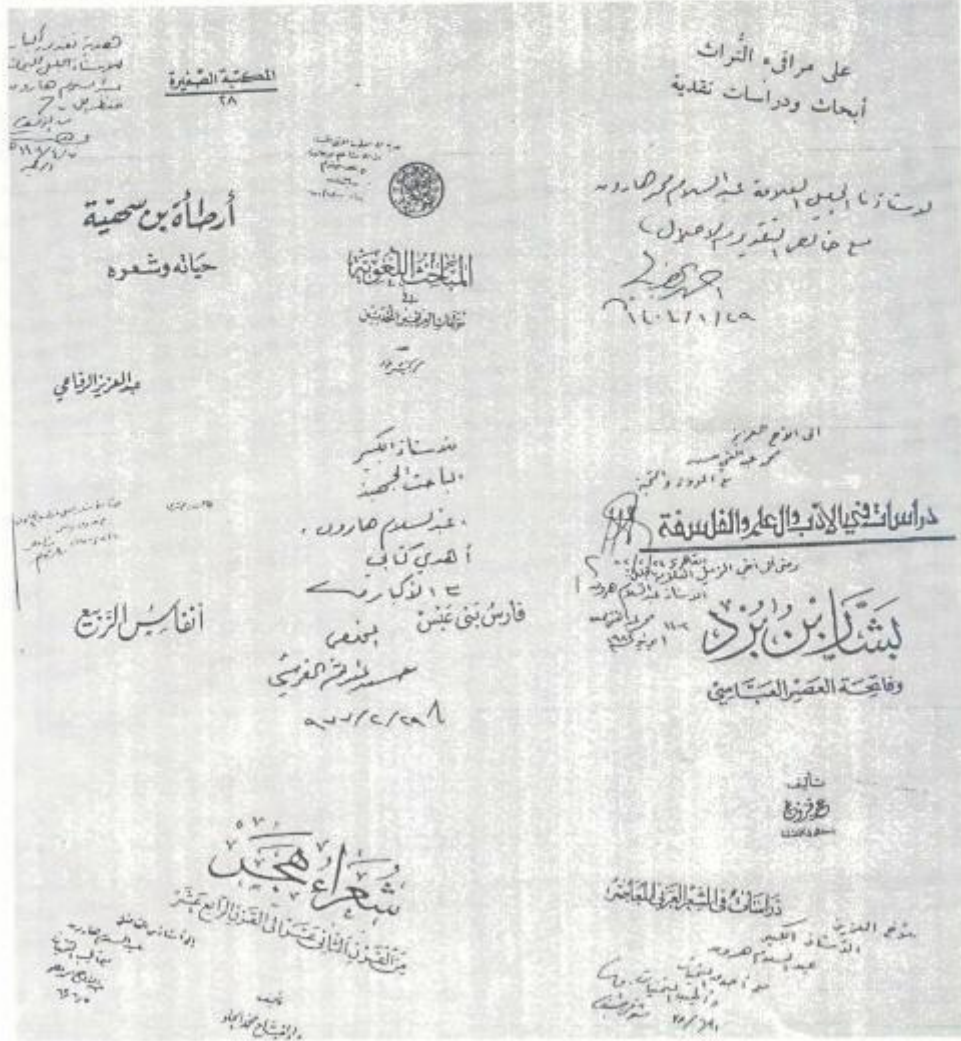
أخبار المكتبة (٧)

ونورد فيما يأتي نماذج من الإهداءات الموجهة إلى العلامة هارون رحمه الله بخطوط أصحابها