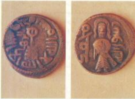
وجه الفلّس ظهر الفلّس

تضم المكتبة حالياً قسماً للمسكوكات يحتوي على ( ٨٨٤٠ ) مسكوكة نادرة من بينها مجموعة تعود الى العصور الرومانية والبيزنطية ، إضافة الى نوادر من العصور الاسلامية المختلفة ، ومجموعة مسكوكات سعودية من عهد الملك عبدالعزيز رحمه الله . وتوضح الصورة المرافقة فلس أموي ضرب الرها من عهد الخليفة عبد الملك بن مروان يحمل في الوجه صورة الخليفة نفسه وعبارة " محمد رسول الله ، أما الظهر فكتبت عليه ( بسم الله لا إله إلا الله وحده - الرها ) . وهذا الفلّس يعود من النوادر .